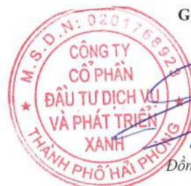
Đông Trung Hải