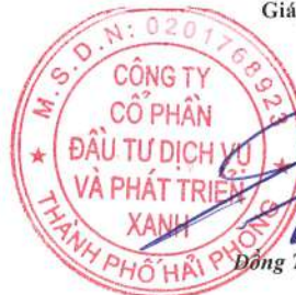
Đông Trung Hải